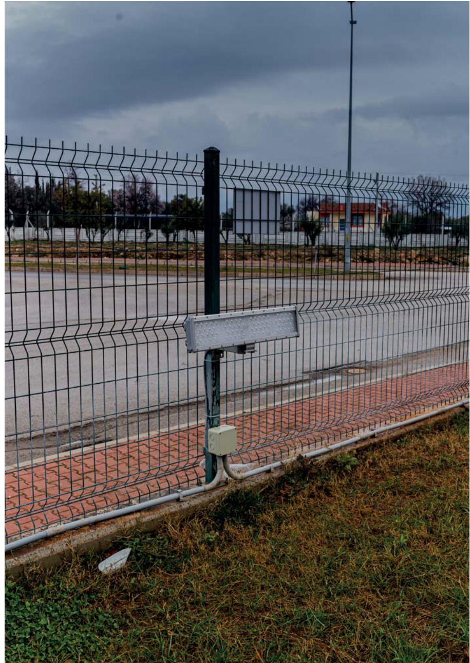
Organize Sanayi Bölgesi, Antalya