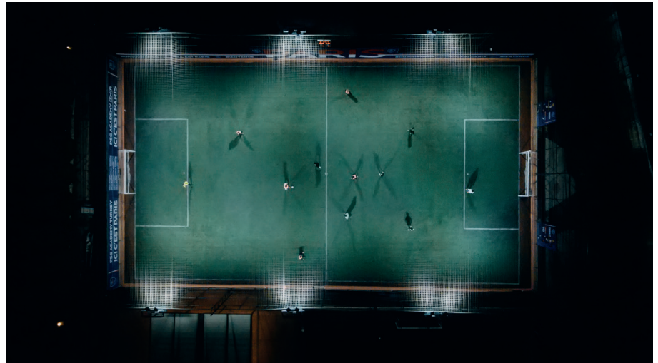
Langırt Spor Tesisleri, İzmir