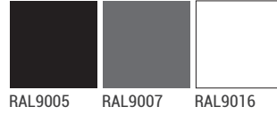
RAL9005 RAL9007 RAL9016