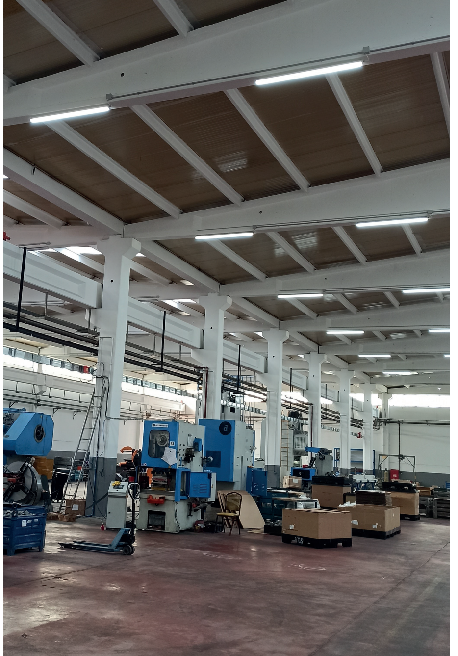
Namtek Fabrikası, Denizli