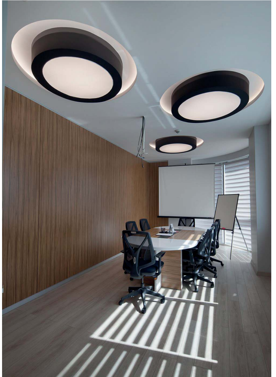
Okandan Cam Yönetim Ofisi, Kayseri