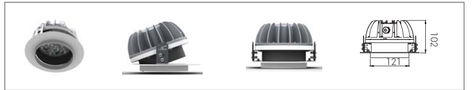
12: Derin Gömme Hareketli*