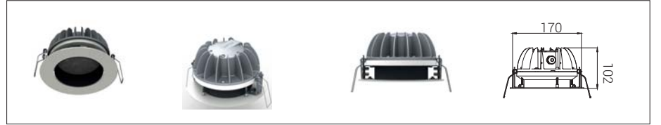
10: Derin Sabit*