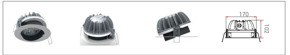
11: Derin Hareketli*